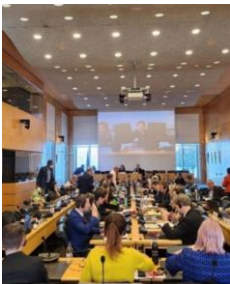
Rhag-sesiwn DU a Jersey gyda Phwyllgor Hawliau'r Plentyn y Cenedloedd Unedig

Cytundeb rhyngwladol yw Confensiwn y Cenedloedd Unedig ar Hawliau'r Plentyn (CCUHP) sy'n nodi hawliau pob plentyn, wedi'i lofnodi gan bron i bob aelod-wladwriaeth yn y Cenedloedd Unedig. Mae 54 o erthyglau yn CCUHP ac maent yn ymdrin ag ystod o hawliau, megis Erthygl 8 – yr hawl i hunaniaeth, Erthygl 19 – yr hawl i gael eich diogelu rhag trais a chamdriniaeth, ac Erthygl 12 – yr hawl i fynegi barn a chael eich cymryd o ddifrif (UNICEF, dim dyddiad). Mae Erthygl 12 yn benodol yn ganolog i'n holl waith yn Cymru Ifanc, ac rydym yn gweithio i sicrhau bod pobl ifanc yn cael eu cymryd o ddifrif drwy gysylltu pobl ifanc â Llywodraeth Cymru mewn gwahanol ffyrdd.