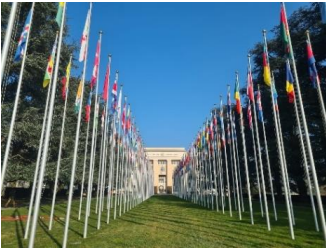
Adeilad y Cenedloedd Unedig yn Genefa, y Swistir

Cytundeb rhyngwladol yw Confensiwn y Cenedloedd Unedig ar Hawliau'r Plentyn (CCUHP) sy'n nodi hawliau pob plentyn, wedi'i lofnodi gan bron i bob aelod-wladwriaeth yn y Cenedloedd Unedig. Mae 54 o erthyglau yn CCUHP ac maent yn ymdrin ag ystod o hawliau, megis Erthygl 8 – yr hawl i hunaniaeth, Erthygl 19 – yr hawl i gael eich diogelu rhag trais a chamdriniaeth, ac Erthygl 12 – yr hawl i fynegi barn a chael eich cymryd o ddifrif (UNICEF, dim dyddiad). Mae Erthygl 12 yn benodol yn ganolog i'n holl waith yn Cymru Ifanc, ac rydym yn gweithio i sicrhau bod pobl ifanc yn cael eu cymryd o ddifrif drwy gysylltu pobl ifanc â Llywodraeth Cymru mewn gwahanol ffyrdd.