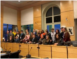
Amddiffynwyr hawliau plant yn dilyn rhag-sesiwn y DU a Jersey

gynnig argymhellion ar sut y gellir gwella'r sefyllfa. Cawsant gyfle hefyd i ateb cwestiynau gan y pwyllgor. Un argymhelliad allweddol a wnaed oedd gwreiddio CCUHP yn llawn yng nghyfraith Cymru.